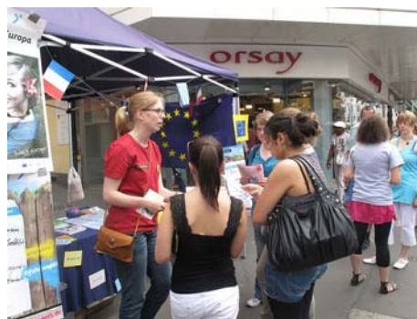
Infostand während der Europäischen Jugendwoche (21.05.2011)

Bei Interesse meldet euch bei uns! Telefon: 0931 7800 78 00 Mail: pra@sjr-wuerzburg.de